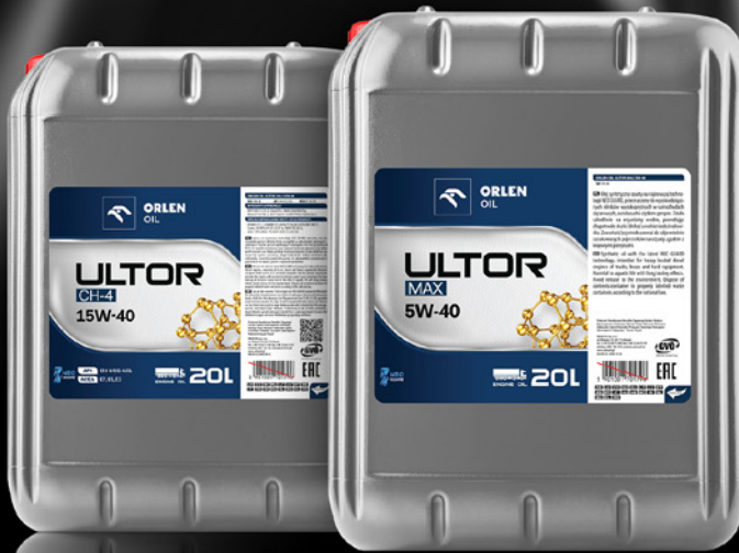
TABELA ZAMIENNIKÓW OLEJE DO SAMOCHODÓW CIĘŻAROWYCH

Nowa, spójna oferta ORLEN OIL jest wynikiem optymalizacji marek, wizerunku i technologii.