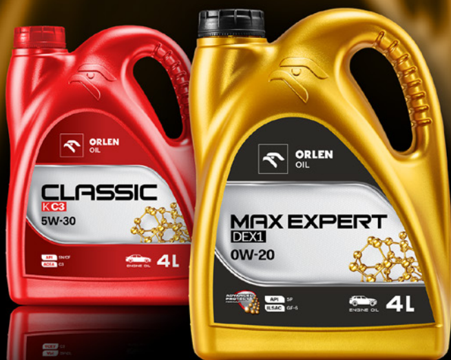
TABELA ZAMIENNIKÓW SAMOCHODY OSOBOWE

Nowa, spójna oferta ORLEN OIL jest wynikiem optymalizacji marek, wizerunku i technologii.